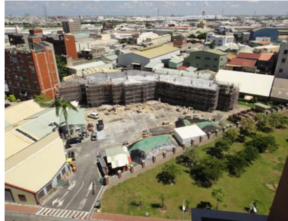
興建中的「能源工程館」