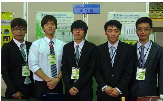
南台科大獲獎同學合影留念

由教育部顧問室與能源國家型科技人才培育計畫大專人才培育計畫辦公室主導之「2011 綠色科技創新創意競賽」於6月1日舉辦參展競賽暨頒獎典禮。該競賽以節能減碳與環保生態相關之創意作品為主，著重融入永續或節能的概念而應用於生活中，參賽之作品須符合綠色設計之概念，即具有「提高效率、改善功能、創造新價值、增加新用途、資源再利用性、生活便利性、環保性、生態永續或節能減碳等其中一項」且具「新穎性」。南台科技大學校長戴謙表示，知識經濟是以「創新」為主流趨勢，唯有藉著創新能力，才能發揮創意、運用知識，進而創造價值。