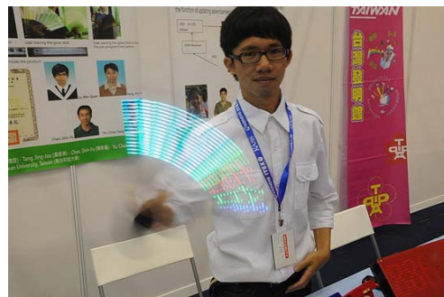
馬來西亞 ITEX 國際發明展南台科大獲獎同學

2011 年馬來西亞 ITEX 國際發明展於日前順利落幕，結束為期三日的展期。今年，馬來西亞 ITEX 國際發明展步入第 22 屆，總展出作品約 725 件，參與展出國家包括韓國、香港、中國、菲律賓、越南、加拿大、台灣、馬來西亞... 等 14 國，為近五年來規模最大，我國代表團全團赴馬來西亞參展團員近 200 人，創我國代表團有史以來參與世界各大發明展人數之最。馬來西亞主辦單位於頒獎儀式上特頒贈大會貢獻獎給我代表團數位服務人員，包含台灣發明商品促進協會林俊亮會長、謝新民榮譽會長、亞洲大學鄧鴻吉老師、虎尾科技大學謝振榆老師、南台科技大學張文俊老師等。其中本校張文俊老師更是連續三年參與馬來西亞國際發明展，屢獲歷屆大會肯定。