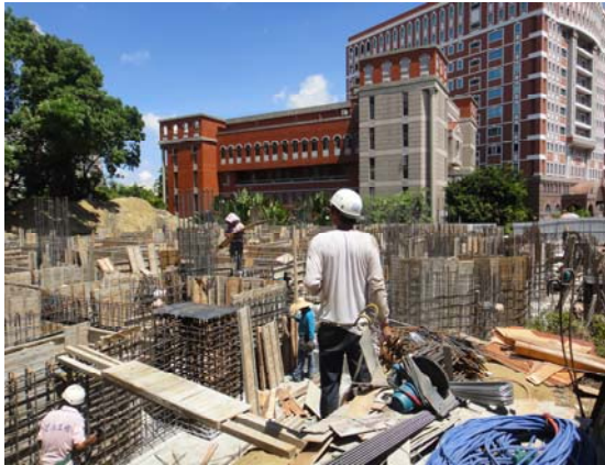
興建中的「運動休閒館」